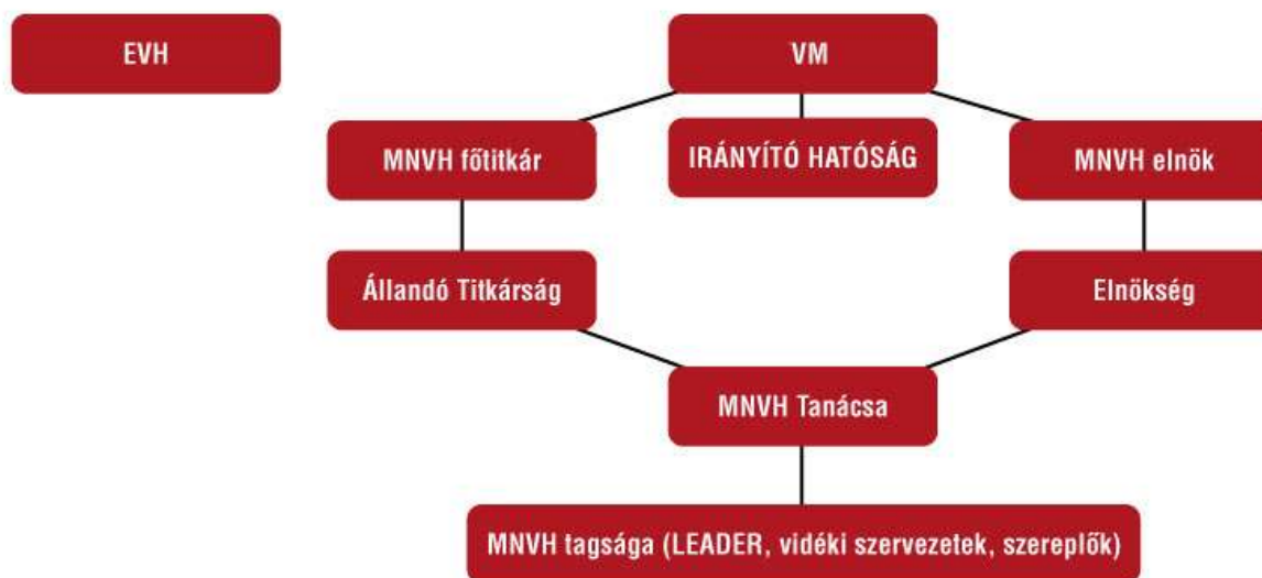
A Magyar Nemzeti Vidéki Hálózat szervezeti ábrája