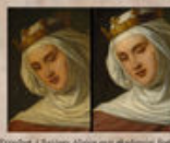
Szent Erzsébet (Szalay Alajos aqr. Művészeti Iskolai, 1868)