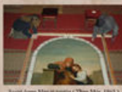
Szent Anna Mária szobra (Thun MSZ, 1867)

Történelmi gyökerek megőrzése és átadása Szent Anna és Szent Erzsébet oltárképek restaurálása.